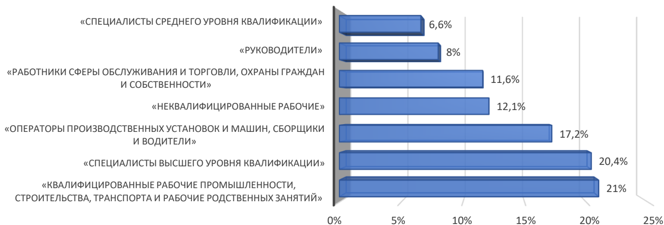
График 2. Анализ потребности в работниках по укрупненным группам занятий по состоянию на 1 января 2024 г.