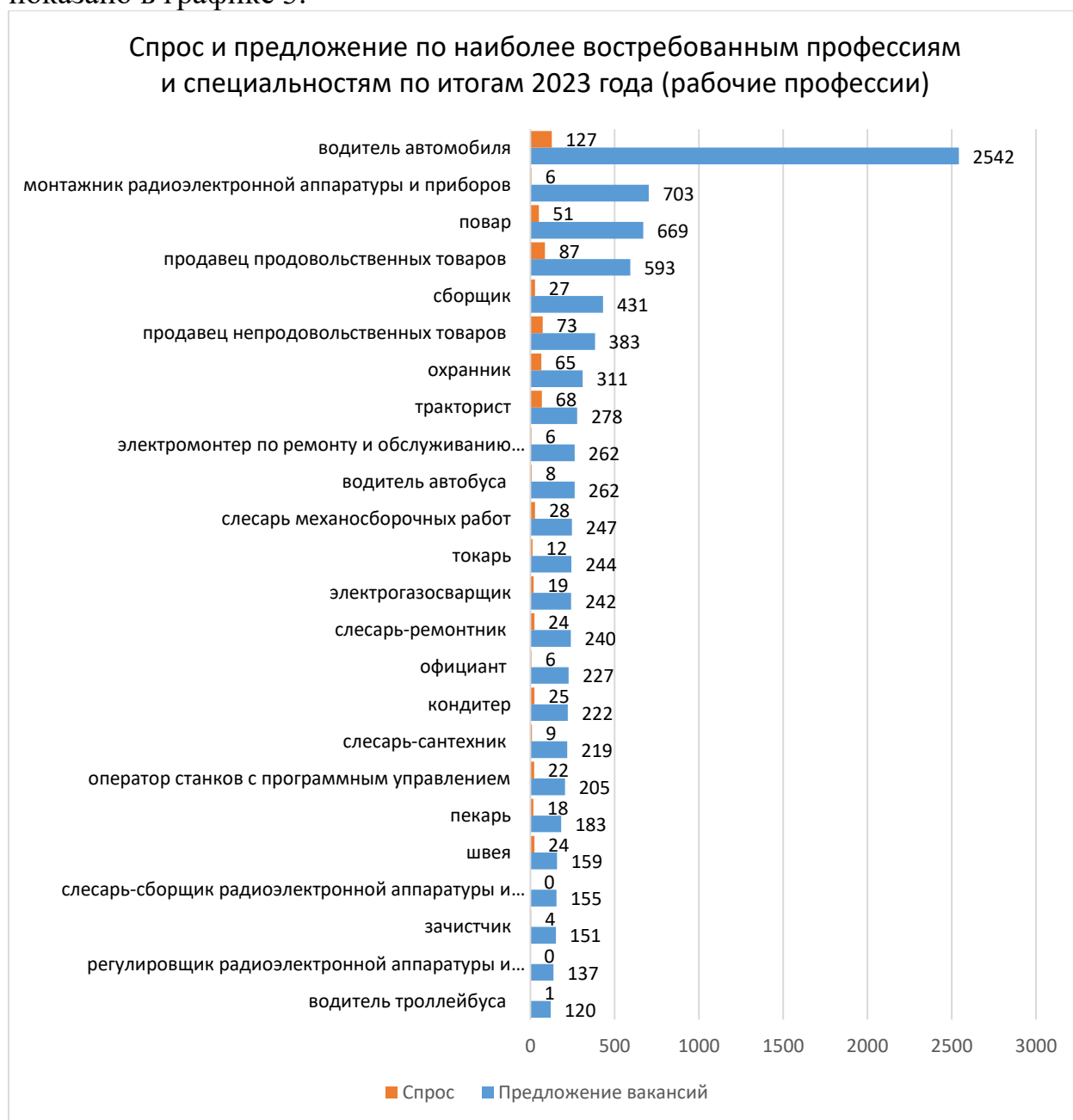
График 3. Предложения вакансий и спрос на них по наиболее востребованным профессиям и специальностям по итогам 2023 года (рабочие профессии)

Наглядно соотношение спроса к предложению по рабочим профессиям показано в графике 3.